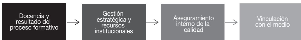
Gráfico 1 Dimensiones del funcionamiento institucional